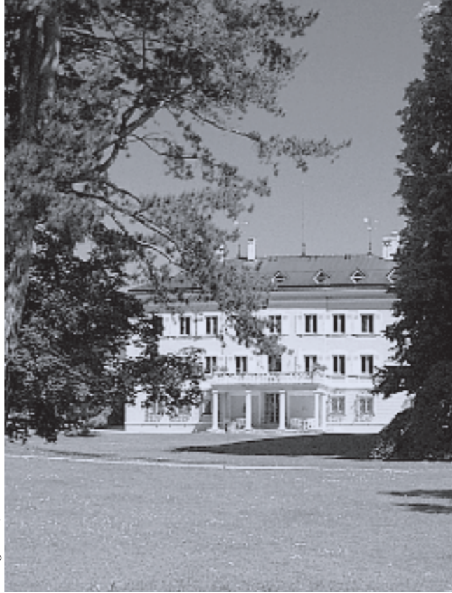
Evangelische Akademie Tutzing

© Konzept und Gestaltung peilstöcker + design Tel. 081 53-990 350 | Druck: Ulenspiegel Druck & Verlag GmbH, Andechs