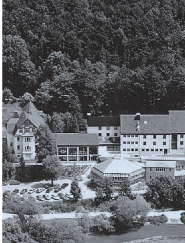
Evangelische Landvolkshochschule Pappenheim