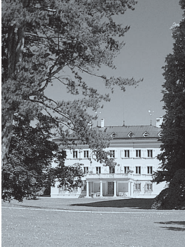
Evangelische Akademie Tutzing

Bildnachweis: Hitoshi Abe, Neige Lune Fleur Bar, 1999, in: Das Geheimnis des Schattens. Licht und Schatten in der Architektur. DAM, Frankfurt/Main, 2002