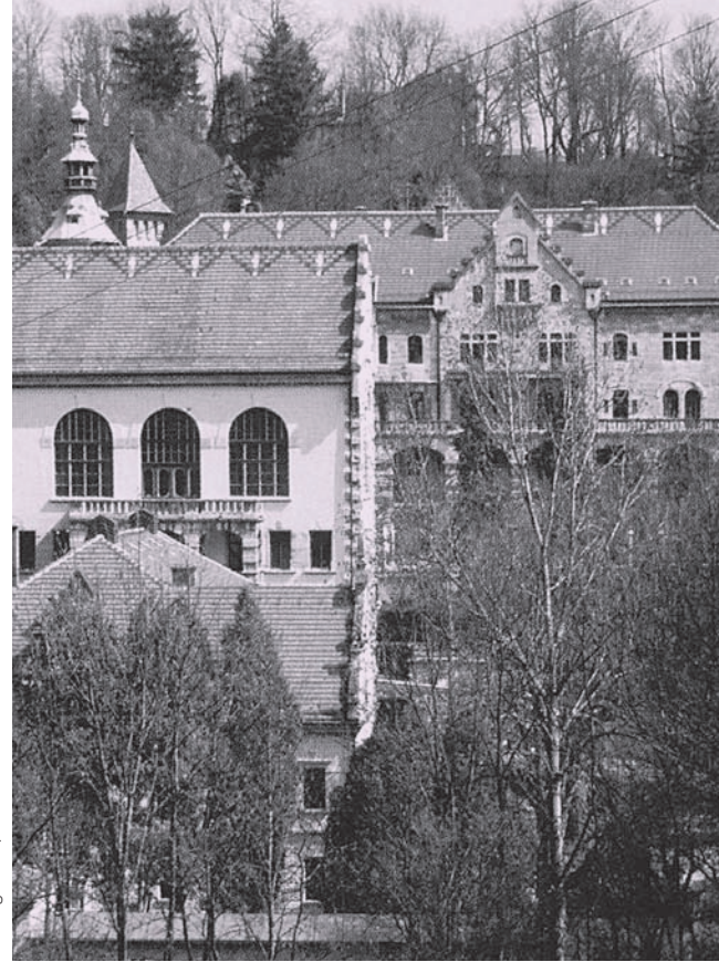
Evangelische Tagungsstätte Wildbad

Die Evangelische Tagungsstätte Wildbad liegt in einer landschaftlich reizvollen Gegend zwischen der Rothenburger Altstadt im Osten und der Tauber im Westen. Das Haus verfügt über 15 Tagungsräume für 10 bis 300 Personen und über Feierabendräume für 30 bis 60 Personen. Für die Unterbringung der Gäste stehen 15 Einzelzimmer, 47 Doppelzimmer sowie 6 Dreibettzimmer zur Verfügung. Die Zimmer sind vorwiegend mit Dusche/WC ausgestattet.