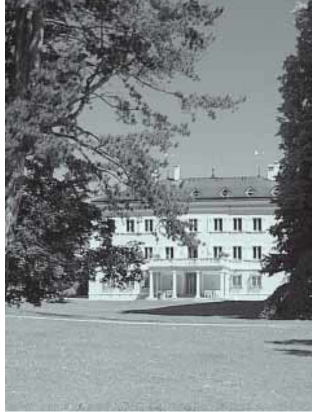
Evangelische Akademie Tutzing

Das traditionsreiche Tutzinger Schloss dient seit 1947 der Evangelischen Akademie als Tagungsstätte. Mit der Gründung des Politischen Clubs (1954) erlangten die Akademietagungen bundesweite Bekanntheit, das Tagungsangebot konnte kontinuierlich erweitert werden.