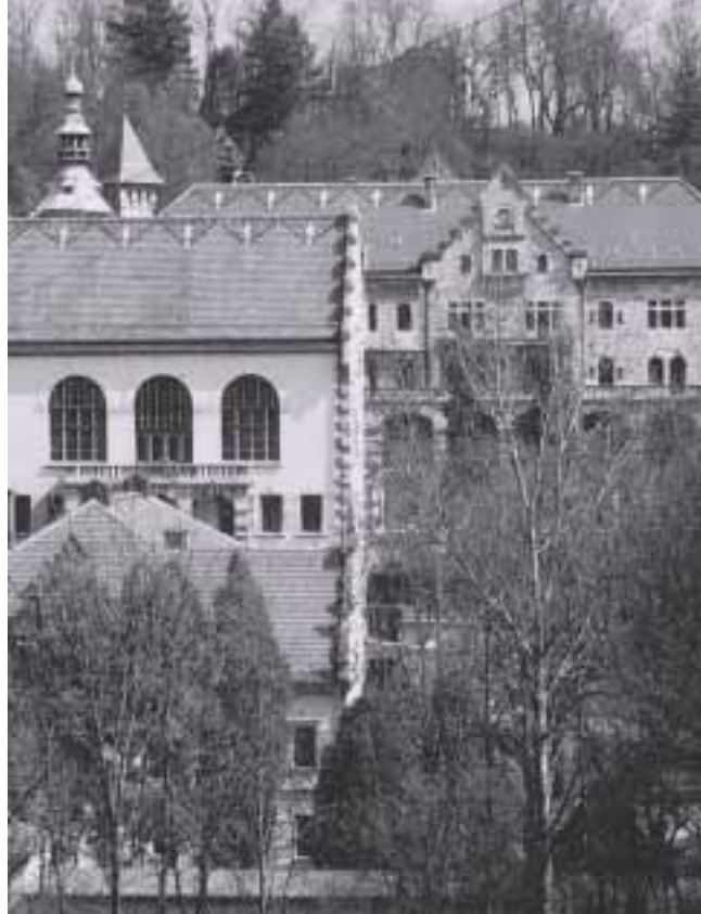
Evangelische Tagungsstätte Wildbad

Die Evangelische Tagungsstätte Wildbad liegt in einer landschaftlich reizvollen Gegend zwischen der Rothenburger Altstadt im Osten und der Tauber im Westen. Das Haus verfügt über 15 Tagungsräume für 10 bis 300 Personen und über Feierabendräume für 30 bis 60 Personen. Für die Unterbringung der Gäste stehen 15 Einzelzimmer, 47 Doppelzimmer sowie 6 Dreibettzimmer zur Verfügung. Die Zimmer sind vorwiegend mit Dusche/WC ausgestattet.